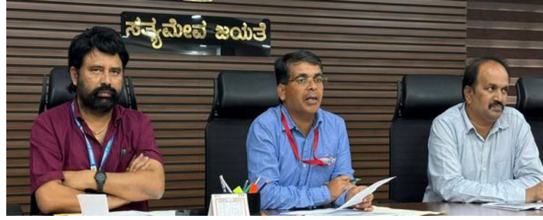
ಕಾಲೇಜುಗಳಲ್ಲಿ ಈ ಕೂಡಲೇ ನಾಮಪುಲಕ ಅಳವಡಿಸಲು ಕ್ರಮ ಕೈಗೊಳ್ಳಬೇಕು ಎಂದು ಅಪರ ಜಿಲ್ಲಾಧಿಕಾರಿಗಳು, ಡಿಡಿಪಿಯು ಅಪರಿಗ ಸೂಚಿಸಿದರು.

ತಂಬಾಕು ಉತ್ಪನ್ನಗಳ ಹಾಕಬೇಕು. ಈ ನಿಟ್ಟಿನಲ್ಲಿ ಸಂಬಂಧಿಸಿದ ಅಧಿಕಾರಿಗಳು ಕ್ರಮ ವಹಿಸಬೇಕು. ನಾಮಪುಲಕ ಹಾಕಿದ ಅಂಗಡಗಳಿಗೆ ನೋಟೀಸ್ ಜಾರಿ ಮಾಡಬೇಕು ಎಂದು ಅವರು ಹೇಳಿದರು.