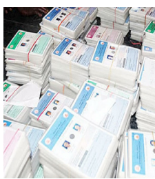
ಬೆಂಗಳೂರು: ರಾಜ್ಯ ಸರ್ಕಾರವು ಹೊಸ ರೇಷನ್ ಕಾರ್ಡ್ ಗೆ ಅರ್ಜಿ ಸಲ್ಲಿಸಲು ಅವಕಾಶ ನೀಡಲಾಗಿದೆ ಎಂಬುದರ ಕುರಿತಂತೆ ಆಹಾರ ಇಲಾಖೆ ಸ್ಪಷ್ಟನೆ ನೀಡಿದ್ದು, ಹೊಸ ರೇಷನ್ ಕಾರ್ಡ್ ಗೆ ಅರ್ಜಿ ಆಹ್ವಾನಿಸಲಾಗಿದೆ ಎಂಬುದು ವದಂತಿಯಾಗಿದೆ ಎಂದು ತಿಳಿಸಿದೆ.

ಸಾಮಾಜಿಕ ಜಾಲತಾಣದಲ್ಲಿ ಹೊಸ ರೇಷನ್ ಕಾರ್ಡ್ ಗೆ ಅರ್ಜಿ ಕರೆಯಲಾಗಿದ್ದು, ಇಂದು ಬೆಳಿಗ್ಗೆ 10 ಗಂಟೆಯಿಂದ ಸಂಜೆ 7 ಗಂಟೆಯವರೆಗೆ ಅವಕಾಶ ನೀಡಲಾಗಿದೆ ಎಂಬ ವದಂತಿ ಹಬ್ಬಿದೆ. ಆದರೆ ಇದಕ್ಕೆ ಆಹಾರ ಇಲಾಖೆ ಸ್ಪಷ್ಟನೆ ನೀಡಿದ್ದು, ರೇಷನ್ ಕಾರ್ಡ್ ನಲ್ಲಿ ತಿದ್ದುಪಡಿಗಾಗಿ ಮಾತ್ರ ಅವಕಾಶ ನೀಡಲಾಗಿದೆ ಎಂದು ತಿಳಿಸಿದೆ. ಸದ್ಯ ಆರೋಗ್ಯ ಸೌಲಭ್ಯಕ್ಕಾಗಿ ಮಾತ್ರ ಅವಕಾಶ ಇದ್ದವರಿಗೆ ಬಿಸಿಎಲ್ ಕಾರ್ಡ್ ನೀಡಲು ರಾಜ್ಯ ಸರ್ಕಾರ ನಿರ್ಧರಿಸಿದ್ದು, ತೀರ್ಪು ಅನರ್ಪಣೆ ಬಿಸಿಎಲ್ ಕಾರ್ಡ್ ಗಳನ್ನು ರದ್ದು ಮಾಡಿ ಅರ್ಜಿ ಸಲ್ಲಿಸುವುದಕ್ಕೆ ಕಾರ್ಡ್ ವಿತರಿಸಲಿದೆ ಎಂದು ಸಿಎಂ ಸಿದ್ದರಾಮಯ್ಯ ತಿಳಿಸಿದ್ದಾರೆ.