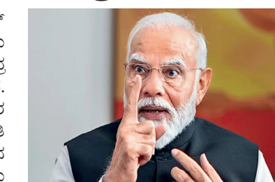
ಮಾಧ್ಯಮಗಳ ಧ್ವನಿಯನ್ನು ಹತ್ತಿಕ್ಕಲಾಯಿತು. ಭಾರತ ಸರ್ಕಾರವು ಪ್ರತಿ ವರ್ಷ ಜೂನ್ 25 ಅನ್ನು 'ಸಂವಿಧಾನ ಹತ್ಯೆ ದಿನ' ಎಂದು ಆಚರಿಸಲು ನಿರ್ಧರಿಸಿದೆ. 1975ರ ತುರ್ತುಪರಿಸ್ಥಿತಿಯ ಅಮಾನವೀಯ ನೋವನ್ನು ಸಹಿಸಿಕೊಂಡವರೆಲ್ಲರ ಅಪಾರ ಕೊಡುಗೆಯನ್ನು ಈ ದಿನ ನೆನಪಿಸುತ್ತದೆ ಎಂದು ಕೇಂದ್ರ ಸಚಿವ ಅಮಿತ್ ಶಾ ಟ್ವೀಟ್ ಮಾಡಿದ್ದಾರೆ.

ನವದೆಹಲಿ: ಕೇಂದ್ರ ಸರ್ಕಾರ ಜೂನ್ 25ನು ಸಂವಿಧಾನ ಹತ್ಯೆ ದಿನ ಎಂದು ಘೋಷಿಸಿದೆ. ಈ ಸಂದರ್ಭ ಕೇಂದ್ರ ಸರ್ಕಾರ ಅಧಿಸೂಚನೆಯನ್ನೂ ಹೊರಡಿಸಿದೆ. ಇಂದಿರಾಗಾಂಧಿ ಪ್ರಧಾನಿಯಾಗಿದ್ದಾಗ 1975ರ ಜೂನ್ 25ರಂದು ದೇಶದಲ್ಲಿ ತುರ್ತು ಪರಿಸ್ಥಿತಿ ಹೇರಲಾಯಿತು. ಹೀಗಾಗಿ ಆ ದಿನವನ್ನು ಸಂವಿಧಾನ ಹತ್ಯೆ ದಿನವಾಗಿ ಆಚರಣೆ ಮಾಡಲಾಗುವುದು ಎಂದು ಕೇಂದ್ರ ಸರ್ಕಾರ ಹೇಳಿದೆ.